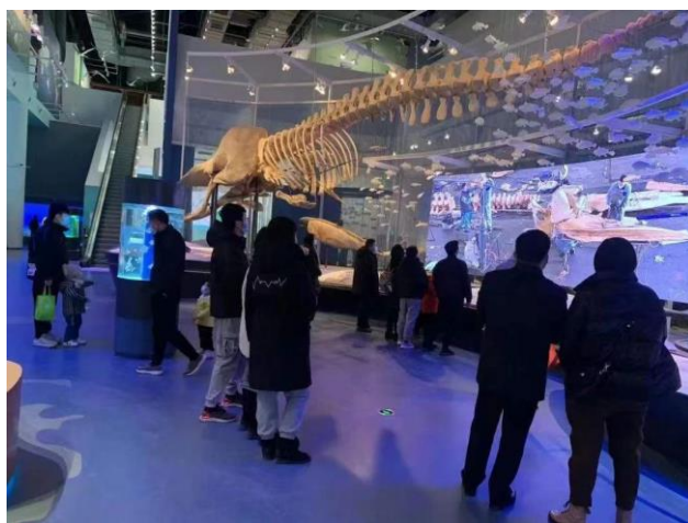
公众参观黄海湿地博物馆

盐城湿地博物园作为博物馆的户外展区，自试开放以来，积极开展黄海湿地少年营自然教育活动，设有湿地课堂、趣味体验、科学探究、艺术绘玩、节日熏陶等具有科普性、互动性、趣味性的多类型教育活动。至今已成功开展 34 期活动，每期活动招募 5 周岁以上孩童及亲子家庭。黄海湿地少年营参营人次约 600 人次，志愿者团队达 50 人。