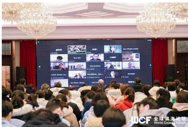
全球滨海论坛会议现场

本次论坛建立了盐城独特的全球滨海城市品牌定位，提高了国际传播能力，提升了城市国际影响力，展现了人口稠密、经济发达地区人与自然的和谐统一，为我国对外交流、国际合作、文明互鉴提供示范案例，为全球生态治理和滨海湿地保护贡献美丽中国的盐城方案。