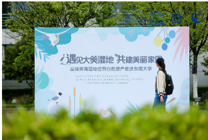
世遗进高校系列活动之走进东南大学篇