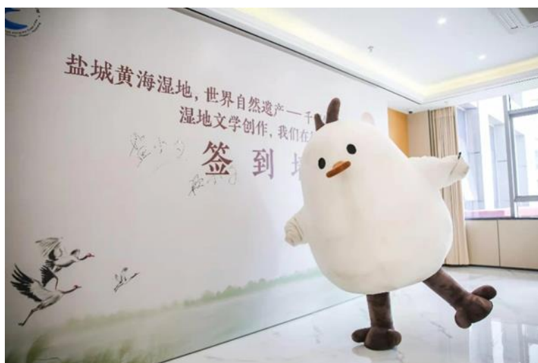
盐城西岸湿地文学创作中心成立大会签到墙

今年，市遗产中心与市文联共同筹划，通过工商部门注册，成立了“盐城西岸湿地文学创作中心”，制定了《湿地文学创作五年行动计划（2022—2026）》，以活动推进湿地文学创作，以评奖提升湿地文学创作水平。有效运用社会资本，聚合民间力量，为提升盐城湿地和世界自然遗产文化内涵而努力前行。