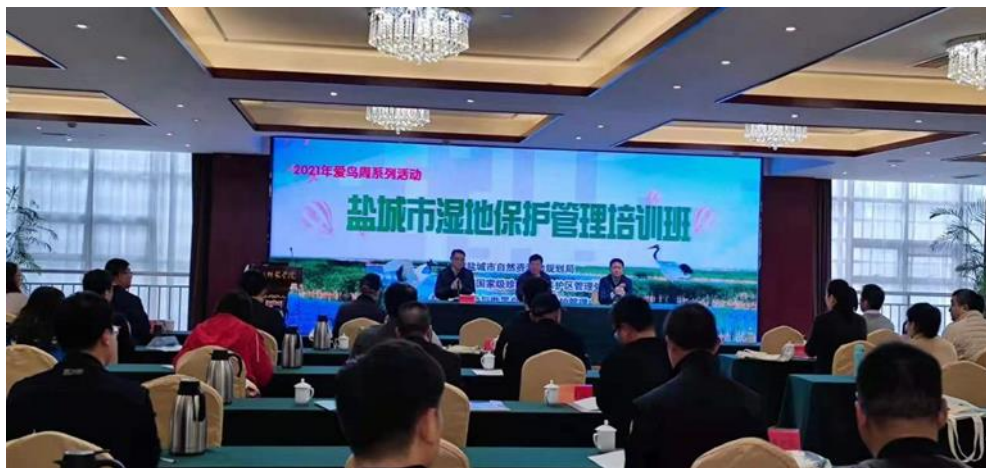
全市湿地保护管理培训班培训

理培训班，旨在进一步加强湿地保护和科学管理，提升我市湿地保护管理水平，促进我市湿地保护管理事业健康有序发展。全市各县（市、区）林业局、盐城主要湿地保护地、湿地公园等相关单位人员参加培训。