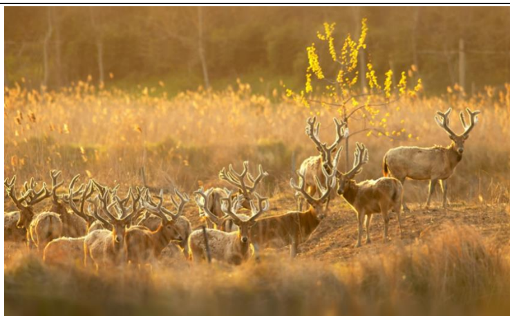
麋鹿保护区野生麋鹿群