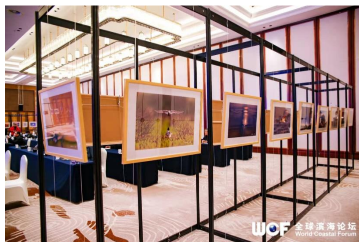
盐城黄海湿地国际摄影大赛获奖作品展示

2022 年 1 月 10 日，该大赛在由自然资源部与江苏省人民政府主办的全球滨海论坛上，举行了颁奖仪式。