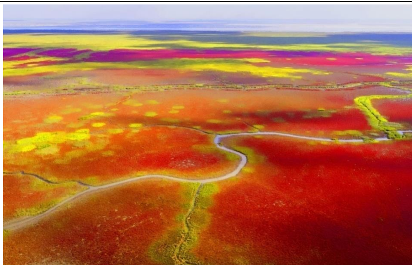
盐城遗产地碱蓬滩涂