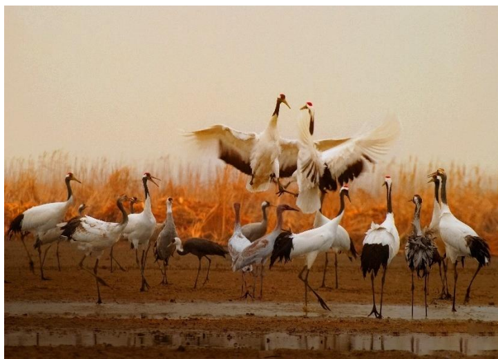
珍禽保护区越冬鹤类集群