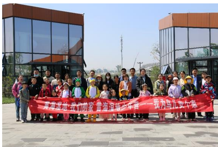
黄海湿地少年营“我为鸟儿安个家”活动

盐城湿地博物园作为博物馆的户外展区，自试开放以来，积极开展黄海湿地少年营自然教育活动，设有湿地课堂、趣味体验、科学探究、艺术绘玩、节日熏陶等具有科普性、互动性、趣味性的多类型教育活动。至今已成功开展 34 期活动，每期活动招募 5 周岁以上孩童及亲子家庭。黄海湿地少年营参营人次约 600 人次，志愿者团队达 50 人。