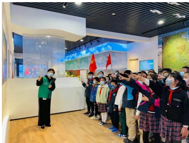
盐城黄海湿地展示中心研学活动现场